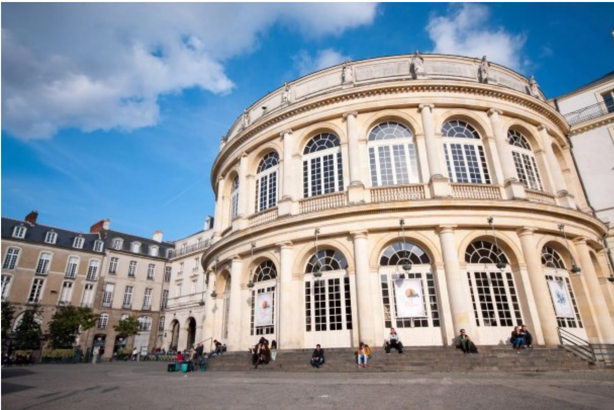
opéra de la ville de Rennes