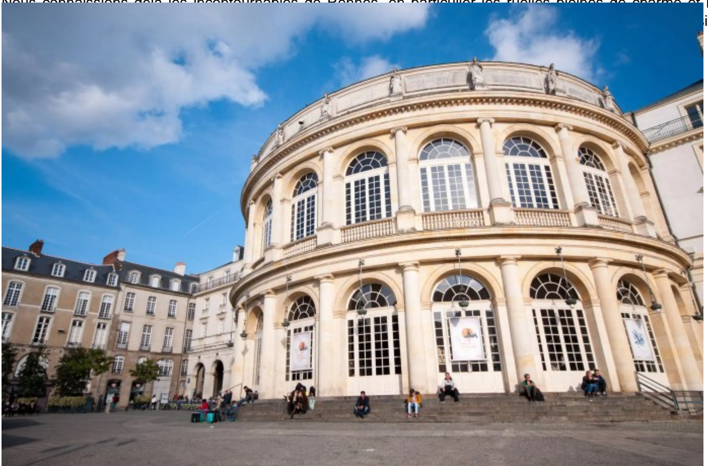
opéra de la ville de Rennes