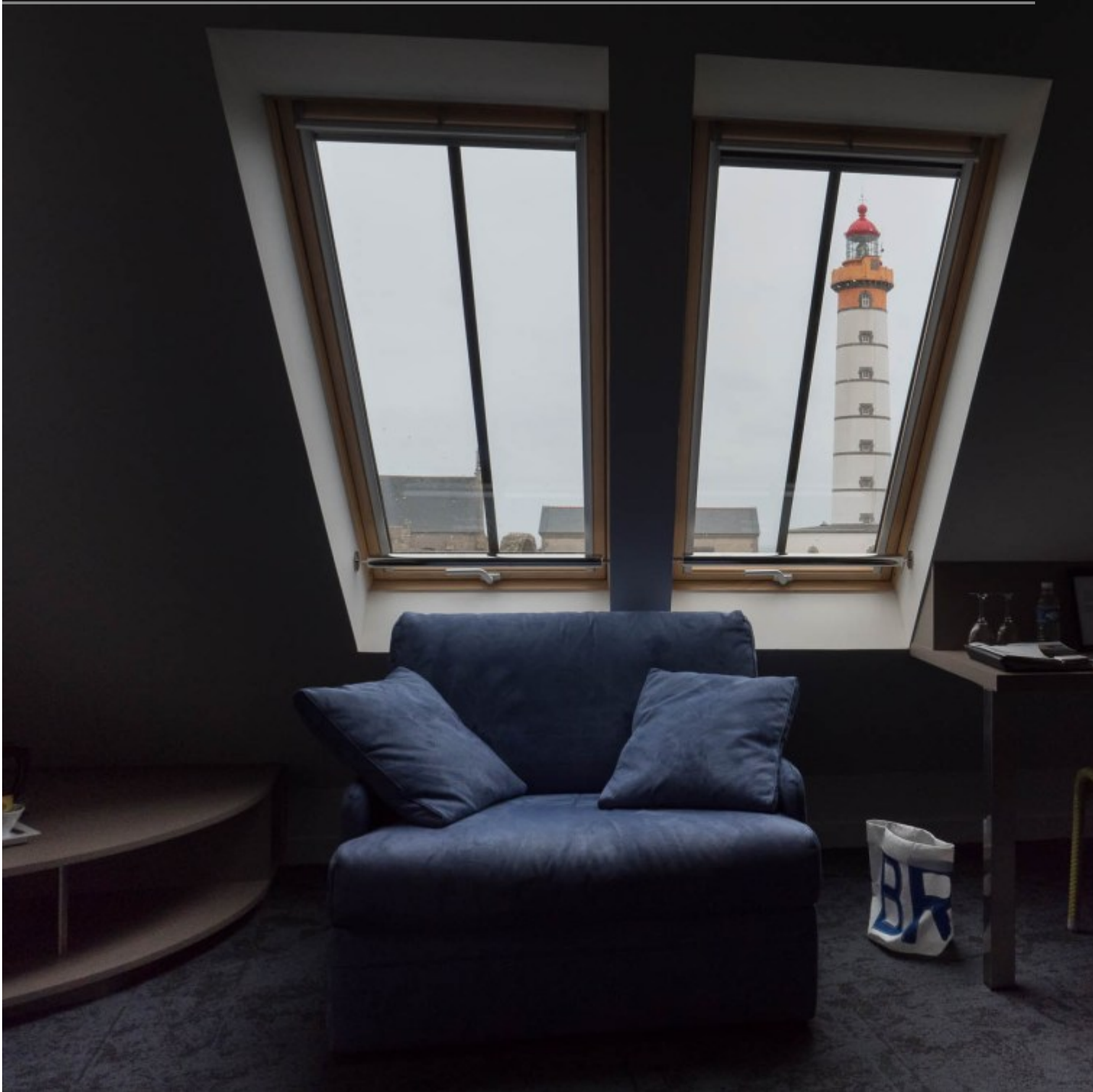
La vue depuis notre chambre à l'hostellerie de la pointe saint mathieu