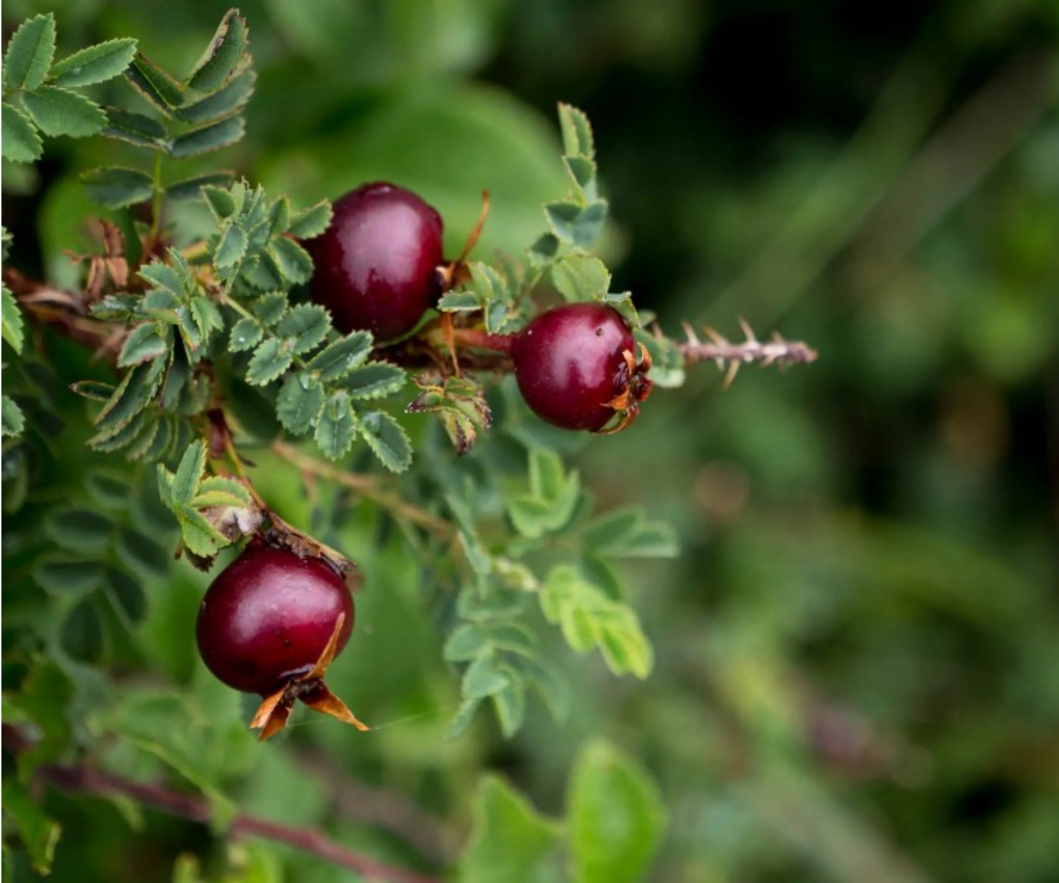
Baie rouge sur la presqu'île de Kermorvan au conquet

Conscients de la chance de pouvoir profiter de cet espace naturel classé depuis 1977, nous nous délectons de la moindre découverte. La presqu'île est naturellement recouverte de lande, mais les fougères sont