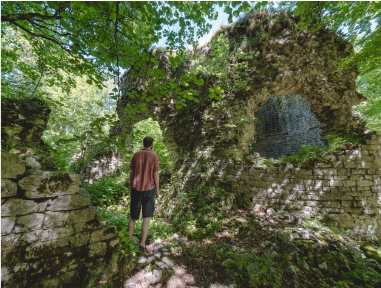
Monastère en ruine près du sommet