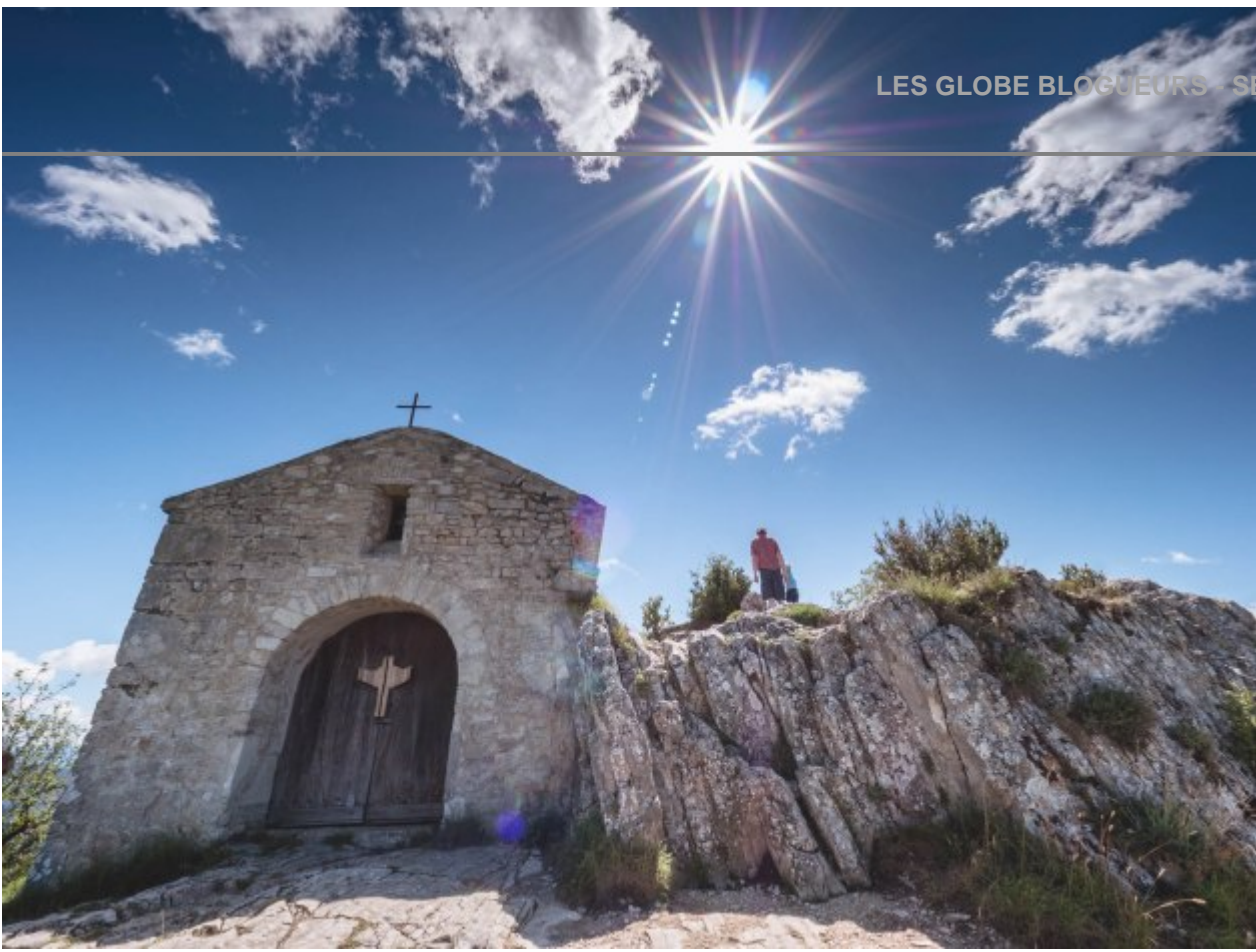
chapelle saint Médard