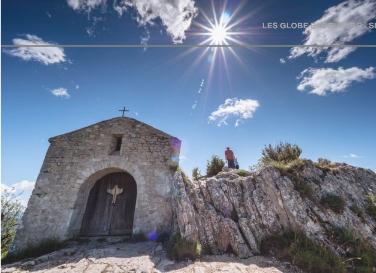
chapelle saint Médard