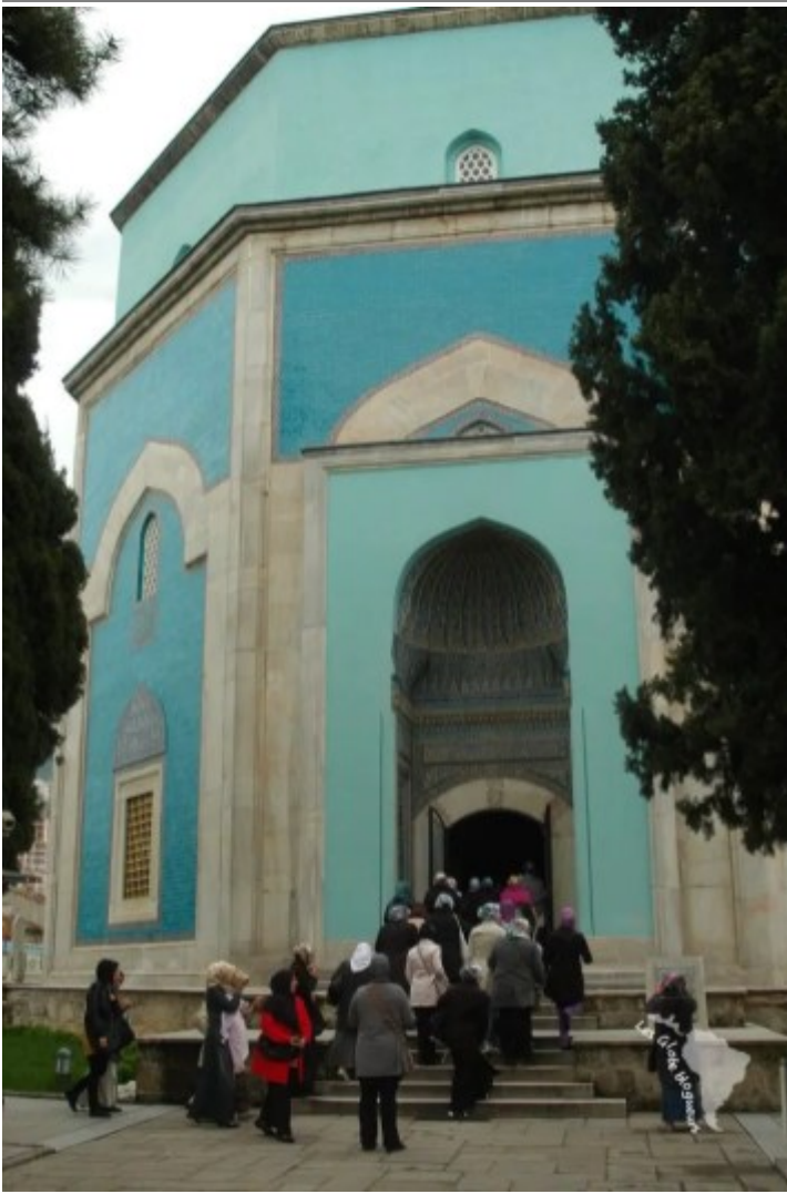
Mausolée vert, Bursa