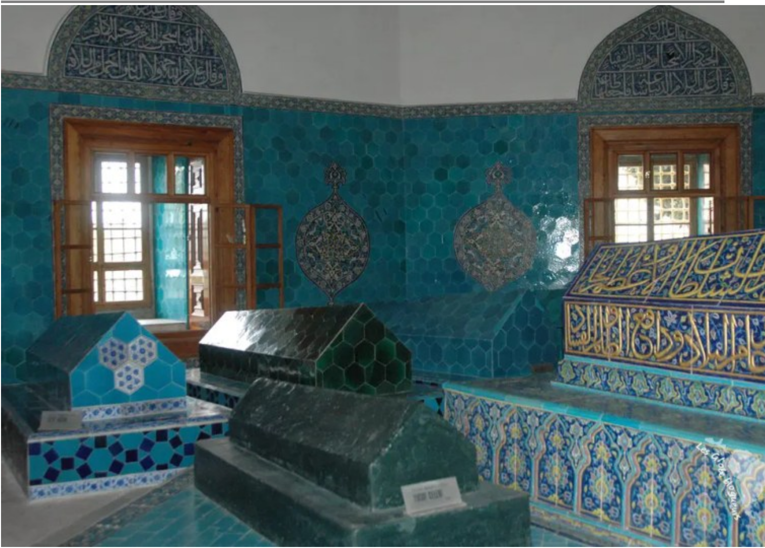
Tombes décorées de faïence, Mausolée vert, Bursa