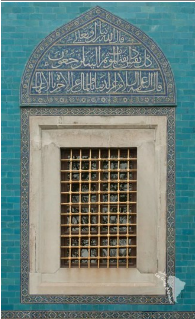
Mausolée vert, détail d'une fenêtre, Bursa

A Bursa, en Turquie, il est possible de visiter de nombreux mausolée d'inspirations persanes et ottomanes. A l'attention des princes, les tombeaux sont richement décorés de faïence notamment turquoise pour le mausolée vert. Certaines tombes sont surmontés du turban, la coiffe princière, ce qui ne laisse aucun doute sur l'importance des défunts.