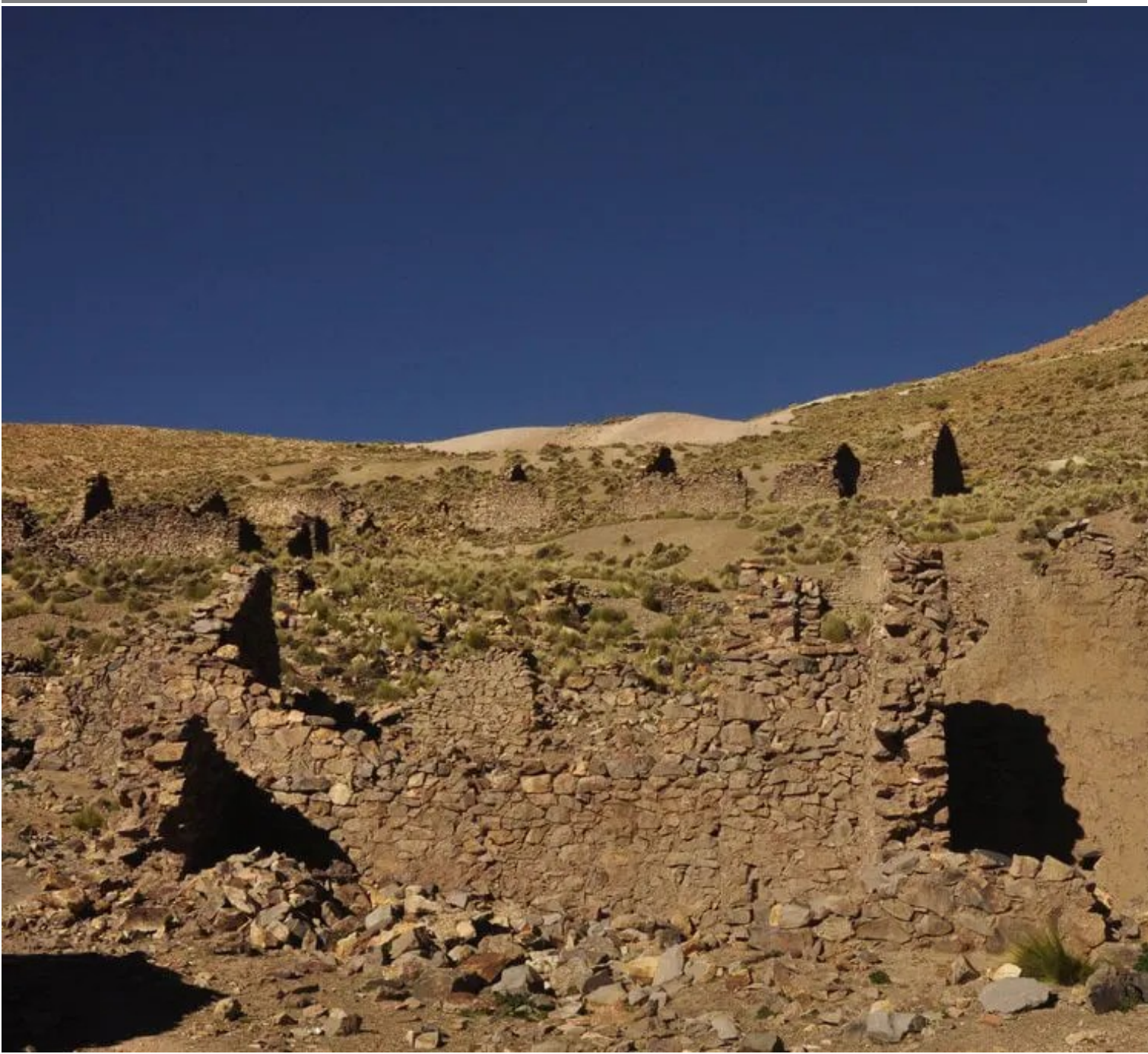
Quelque part dans le sud lipez