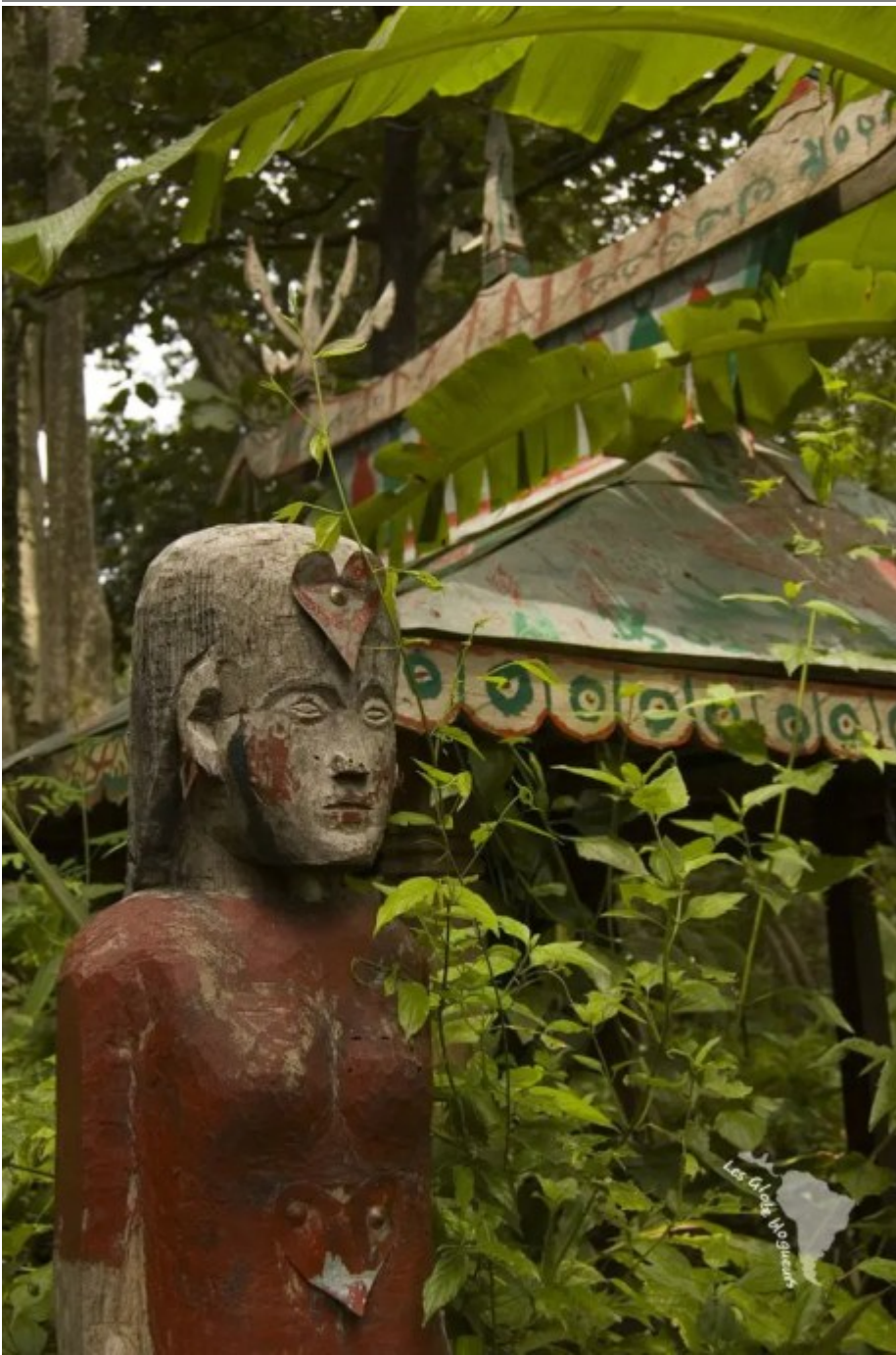
Efigie du défunt