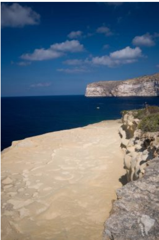
Chemin grignoté par le vent qui mène aux salines