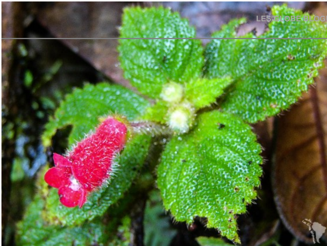
Fleur sur le sentier des cascades