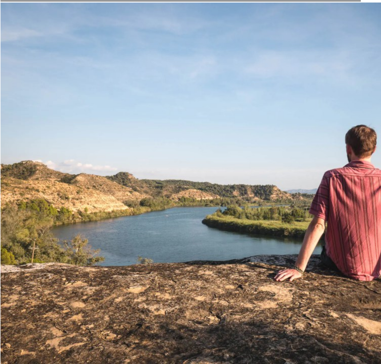
Méandre non loin de Flix