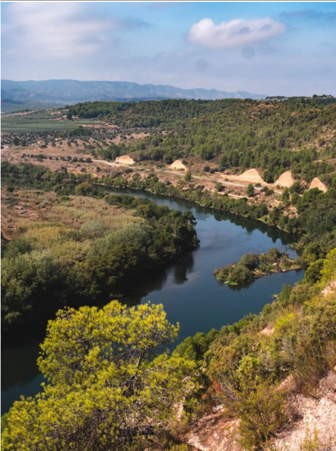
Méandre de flix (enfin une partie !)