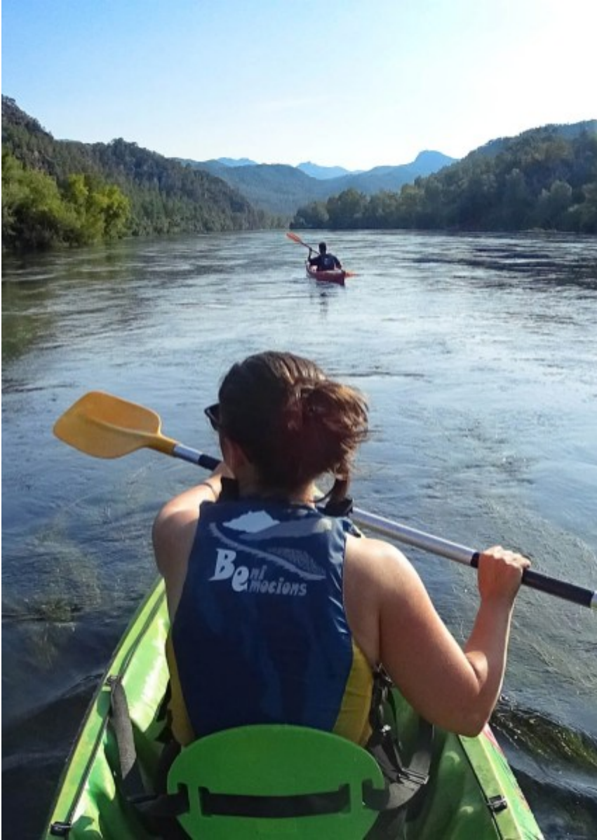
En Canoë sur l'Ebre entre Benifallet et Miravet

Le cortège de libellules et le saut des poissons nous indique le chemin. Il paraît qu'un poisson énorme, de plusieurs mètres, se cache ici. Un monstre trouillard qui s'échappe dès qu'on s'en approche. L'Ebre est majestueux, ses hauts reliefs, sa verdure nous offrent une bulle irréaliste. Nous sommes seuls, seulement quelques bateaux brisent parfois ce silence absolu. Je crois n'avoir jamais autant ressenti cette sensation de privilège.