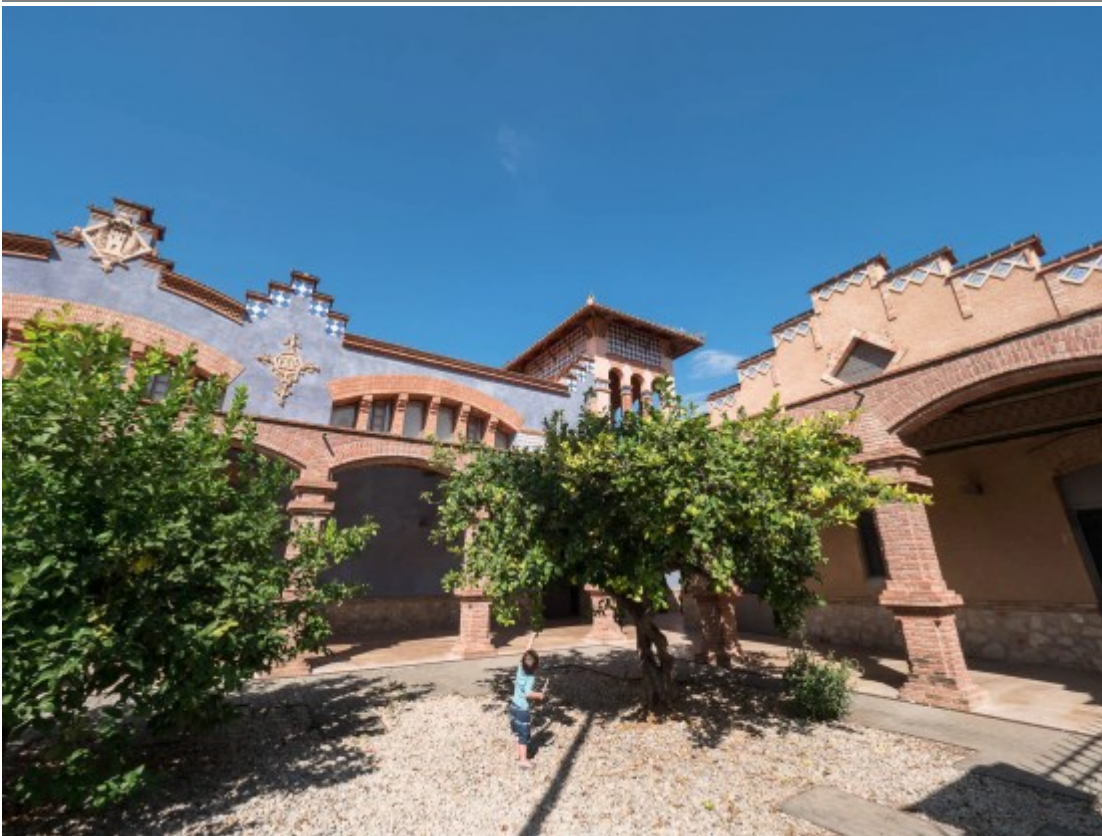
Cette architecture m'a conquise !