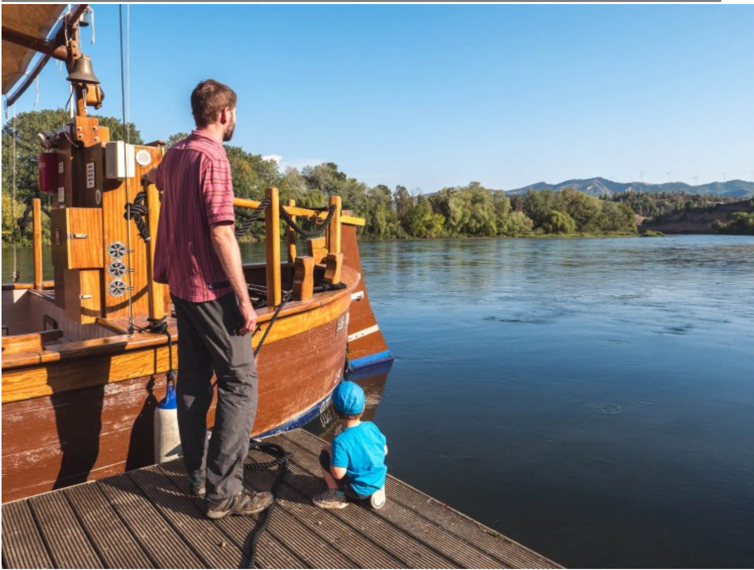
Bateau traditionnel catalan