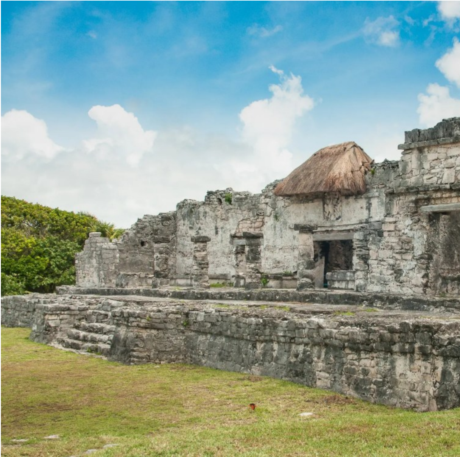
Ruines de Tulum

Les vestiges actuels remontent à la période classique (vers 1200), la cité continuera d'être habitée bien après l'arrivée des conquistadors et sera peu à peu abandonnée au XVI e siècle.