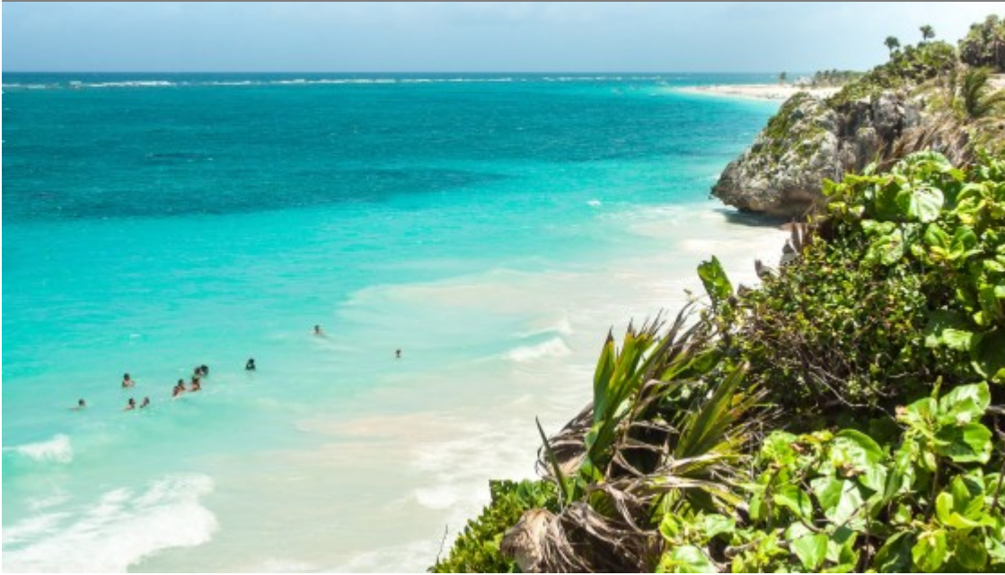
La plage au pied des ruines

Il est possible d'aller se baigner sur différentes plages attenantes, ce que nous n'avons pas manqué de faire étant donné la fournaise que constitue cette merveille.